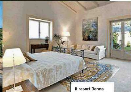
Il resort Donna Coraly, Contrada San Michele (Siracusa).