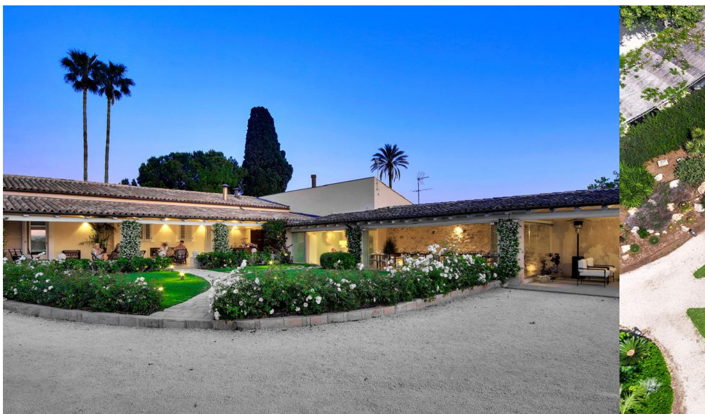
1-6 VEDUTA ESTERNA DONNA CORALY RESORT.

E ' la Mini Spa Cocoti l'ultima novità del Donna Coraly Resort . Concepita come un'oasi per il relax e il benessere psicofisico arricchisce questa struttura ospitale situata in una delle zone più belle della Sicilia, alle porte di Siracusa e a soli due chilometri dalle spiagge della costa sud dell'isola. Ospitata in una villa gentilizia che fa parte di un'anticamasseria fortificata del XV secolo, nella